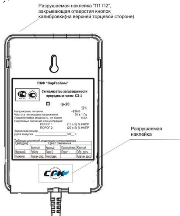
Фото 2 - Схема пломбировки сигнализатора от несанкционированного доступа и обозначение мест для нанесения наклеек с клеймом поверителя