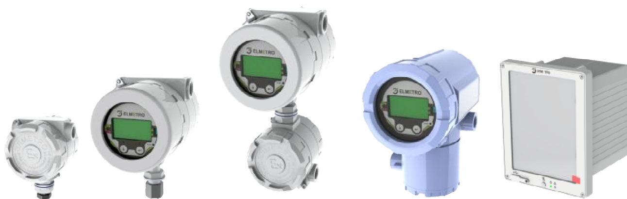
Рисунок 2 - Конструктивные исполнения модулей электронного преобразователя расходомера