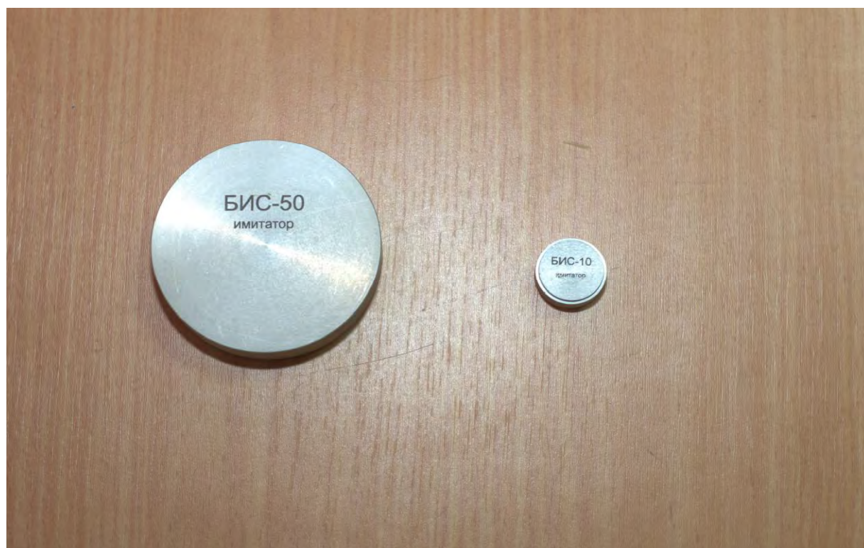
Рисунок 1б – Внешний вид источников БИС-50 и БИС-10