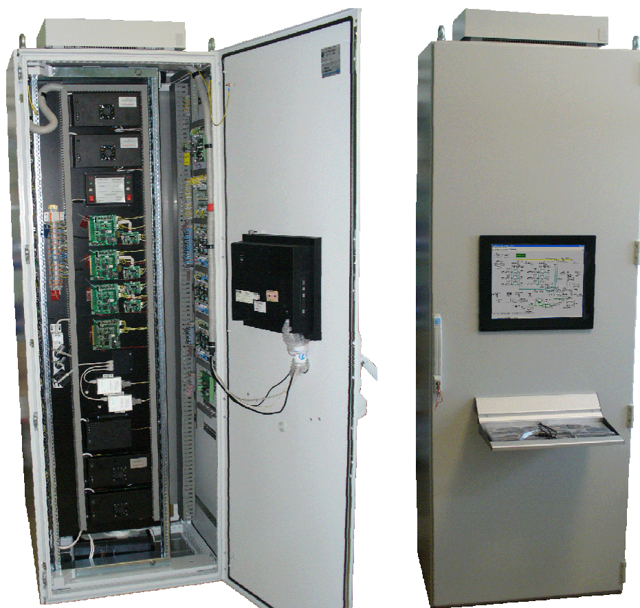
Рисунок 1.1 – Шкаф управления ПТК «Космотроника»