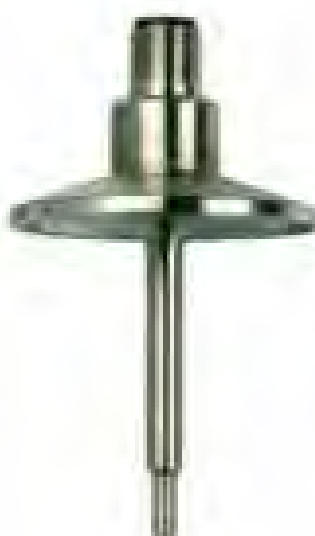
WTh 30 CP