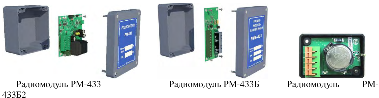
Рисунок 2б. Фотографии общего вида аппаратных средств ПТК «Спрут-М» - радиомодулей РМ-433.