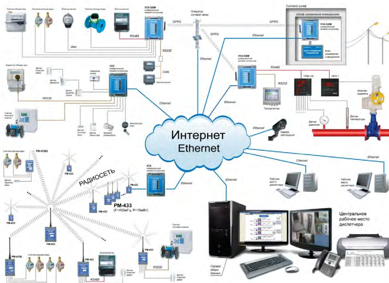
Рисунок 1. Структурная схема ПТК «Спрут-М».

Структурная схема ПТК "Спрут-М" представлена на рис. 1.