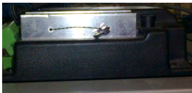
Фото 1.3 - Пломбирование вычислительного устройства WWC