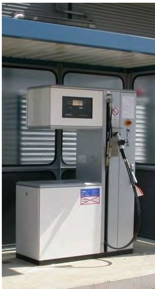
Фото 1.1 - Общий вид колонок

Общий вид колонки показан на фотографиях 1.1 – 1.2.