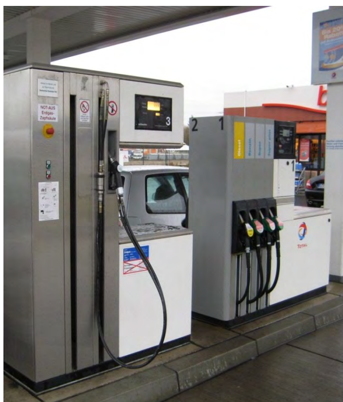
Фото 1.2 - Общий вид колонок