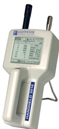
Рисунок 1 - Общий вид счетчика

На рисунке 1 представлен общий вид счетчика, на рисунке 2 показана схема его пломбировки.