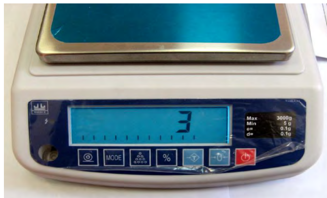
Рисунок 1 - Индикация кода юстировки