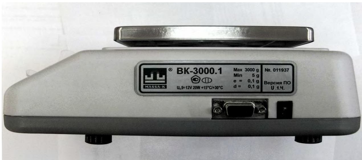
Рисунок 4 – Общий вид весов. Маркировка весов

Маркировка весов производится на фирменной, разрушающейся при снятии, пластине (Рис. 2), на которой нанесено: