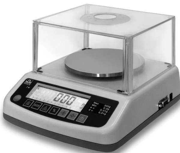
Рисунок 3 – Общий вид весов