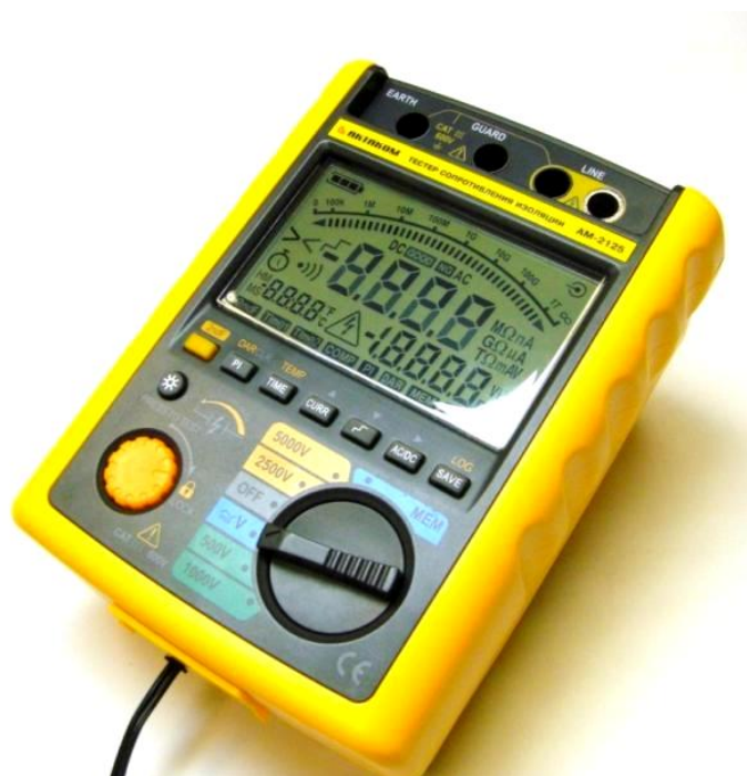
Рисунок 1. Фотография общего вида тестера.