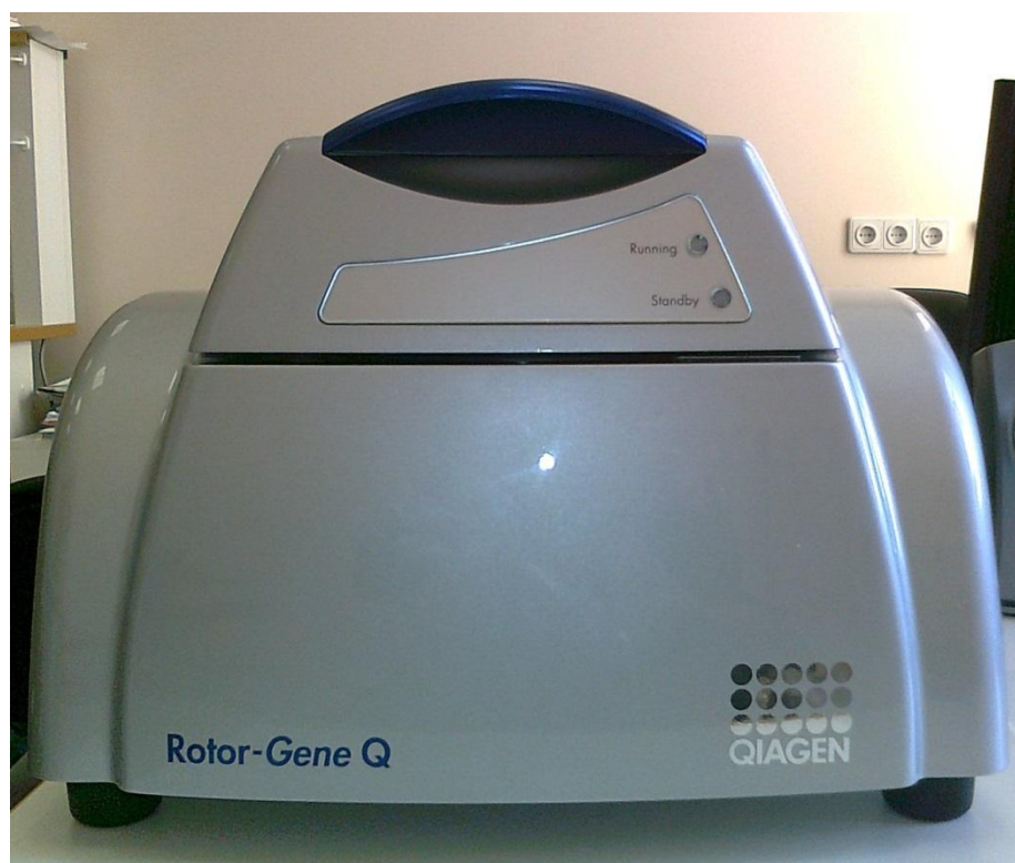
Рисунок 1 - Общий вид прибора для проведения полимеразной цепной реакции в режиме реального времени Rotor-Gene Q