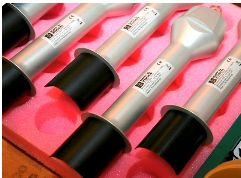
Рисунок 1 – Внешний вид пиргелиометра СНР 1

Сушильная кассета (поглотитель влаги) в корпусе радиометра заполнена силикагелем и предотвращает появление росы на внутренних сторонах окон.