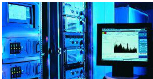
Рисунок 1 Внешний вид системы