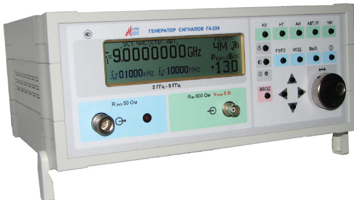
Рисунок 1. Общий вид генератора