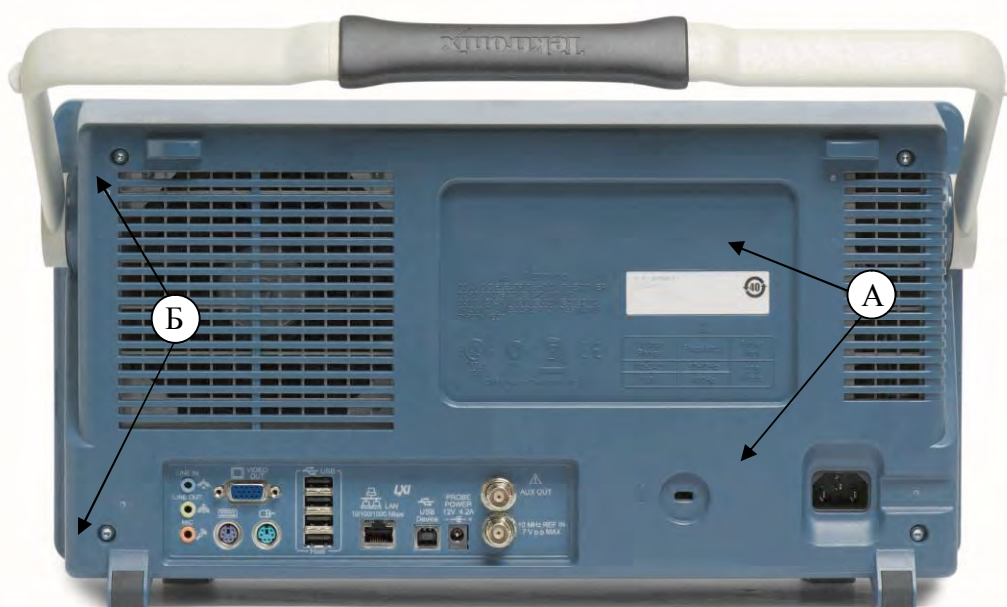
Рисунок 2 – А) Места для размещения наклеек; Б) Возможные места для пломбировки от несанкционированного доступа