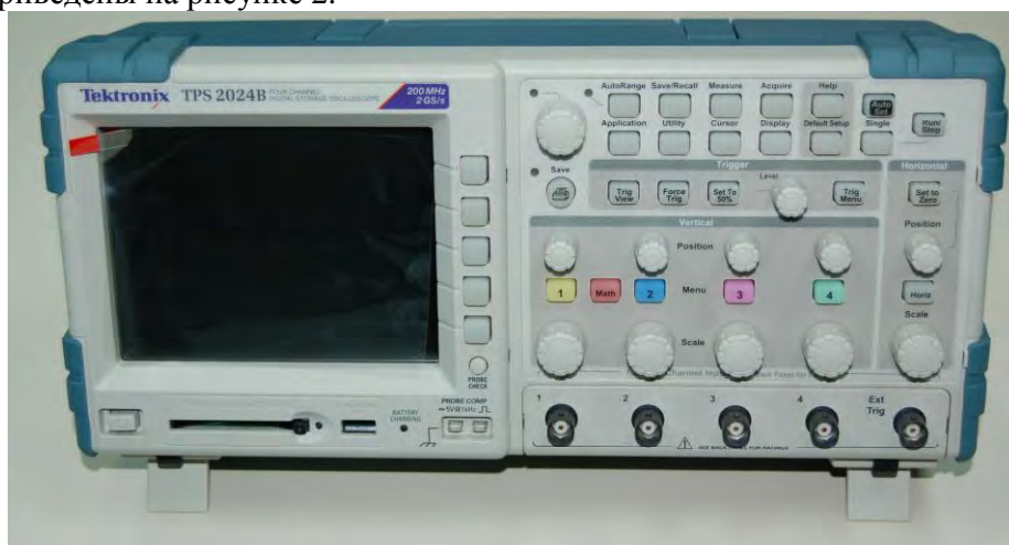
Рисунок 1. Фотография общего вида осциллографа

Схема пломбировки от несанкционированного доступа и обозначение мест для размещения наклеек приведены на рисунке 2.