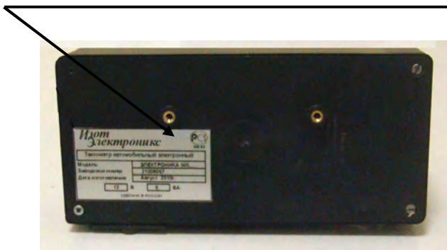
Рис.2. Общий вид таксометров «ЭЛЕКТРОНИКА 505»

Место нанесения знака утверждения типа СИ