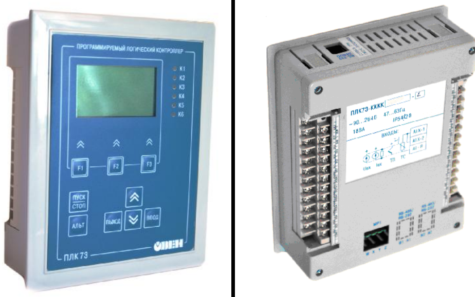
Рис.1 - Общий вид контроллеров логических программируемых ПЛК73

Фотографии общего вида контроллеров приведены на рисунке 1.