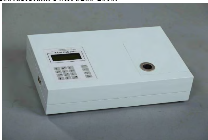
Рисунок 1 – Внешний вид установки «Тангенс-3М»

Уровень защиты программного обеспечения от непреднамеренных и преднамеренных изменений – «А» в соответствии с МИ 3286-2010.