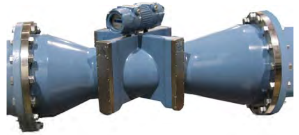
Рисунок 2 – Фотография общего вида расходомера ультразвукового LEFM 280CiRN, Ду=400 мм