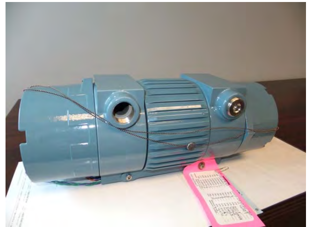
Рисунок 4 – Место пломбировки трансмиттера расходомера ультразвукового LEFM 280CiRN