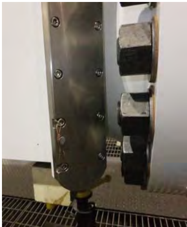
Рисунок 3 – Места пломбировки блоков ПАП на корпусе расходомера ультразвукового LEFM 280CiRN