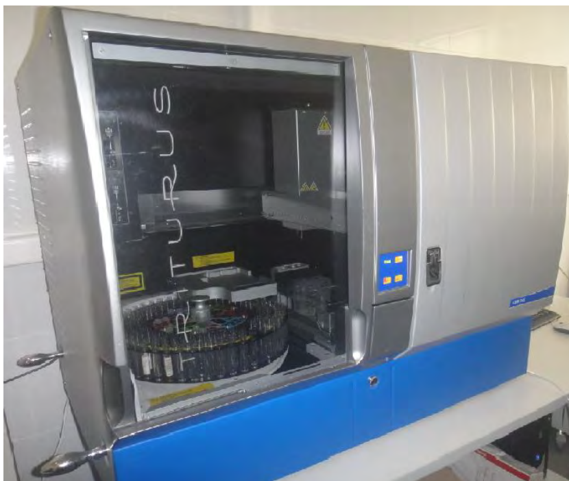
Рисунок 1 – Общий вид анализатора

Управление и обработка результатов измерения анализатора производится с внешнего ПК