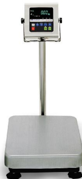
Весы серии HW-WP

Весы снабжены следующими устройствами (в скобках указаны соответствующие пункты ГОСТ Р 53228-2008):