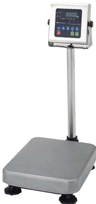
Весы серии HV-WP Рисунок 1 – Общий вид весов

Конструктивно весы состоят из грузоприемного устройства и индикатора с сенсорной клавиатурой на стойке. ГПУ, в свою очередь, состоит из грузопередающего устройства и весоизмерительного устройства с весоизмерительным датчиком (далее датчик).