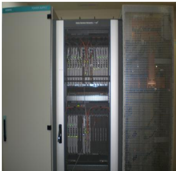
Рисунок 1- Общий вид оборудования с открытой дверью

Общий вид оборудования и схема пломбировки от несанкционированного доступа, представлены на рисунках 1 и 2.