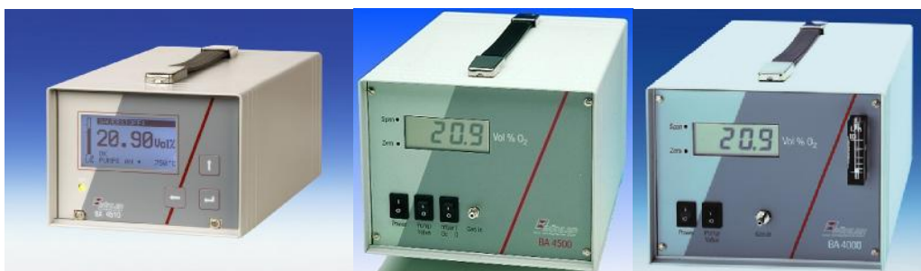
Фотографии анализаторов моделей 4510, 4500, 4000

Анализаторы моделей BA 4000, BA 4500, BA 4510 смонтированы в компактном корпусе предназначенном для переноски и специально предназначены для проведения измерений содержания кислорода при помощи, циркониевых, электрохимических или парамагнитных сенсоров, устанавливаемых внутри корпуса. Опционально устанавливается встроенный компрессор доставляющий измеряемый газ к ячейке. Модель 4510 имеет большой ЖК дисплей и сенсорные клавиши управления, также эта модель может оснащаться специальной циркониевой ячейкой для измерения кислорода в газах содержащих горючие вещества. Модель 4000 и 4500 имеют штуцеры подачи пробы на передней панели прибора, модель 4500 может использоваться для подключения специальной иглы для забора пробы из внутреннего пространства упаковок. Модель 4000 имеет дополнительный ротаметр на передней панели прибора.