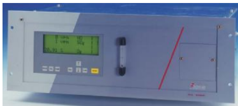
Фотография анализатора модели BA 5000

Анализаторы моделей BA 6000 и BA 7000 предназначены для установки одного или двух измерительных сенсоров, все внутренние линии приборов выполнены из специальных материалов имеющих минимальные сорбционные свойства.