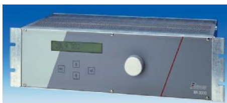
Фотография анализатора модели ВА 3000