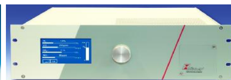
Фотография анализатора модели ВА 3 select

Анализатор модели ВА3000 предназначен для установки одного измерительного сенсора, оснащен жидкокристаллическим дисплеем и фильтром тонкой очистки.