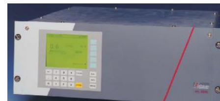
Фотография анализатора модели BA 6000

Анализаторы моделей BA 6000 и BA 7000 предназначены для установки одного или двух измерительных сенсоров, все внутренние линии приборов выполнены из специальных материалов имеющих минимальные сорбционные свойства.