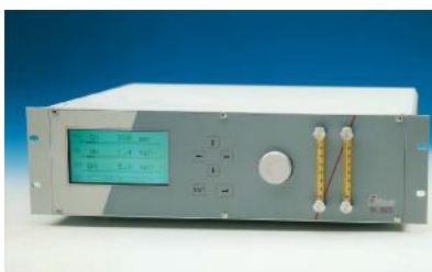
Фотография анализатора модели ВА 3500