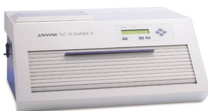
Рис. 6 Измерительный блок TLC SCANNER 3

Измерительный блок TLC Visualizer с цифровой камерой высокого разрешения предназначен для цифровой фотографии пластин с флуоресцентными веществами в ультрафиолетовой части спектра.