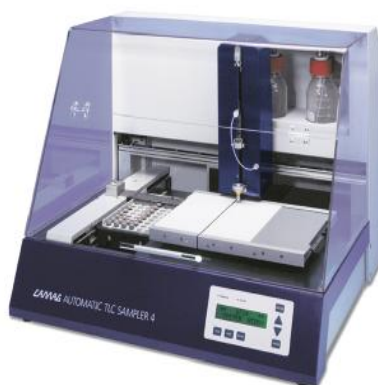
Рис.2 Блок для нанесения пробы ATS 4

Автоматический блок дозирования ATS 4 наносит раствор анализируемого вещества на пластину как распылением, так и контактным способом (перенос раствора непосредственно на слой сорбента). Диапазон объемов дозирования - от 1 \cdot 10^{-4} \text{ см}^3 до 1 \text{ см}^3 в зависимости от концентрации и способа нанесения.