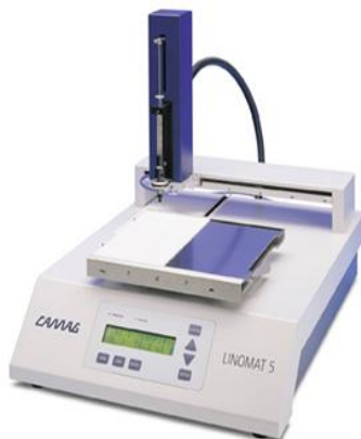
Рис.1 Блок для нанесения пробы Linomat 5

Полуавтоматический блок Linomat 5 наносит раствор анализируемого вещества на пластину с тонким слоем адсорбента. Способ нанесения – распыление раствора на слой сорбента на пластине. Объемы дозирования от 5 \cdot 10^{-4} \text{ см}^3 до 5 \cdot 10^{-1} \text{ см}^3 .