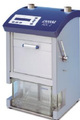
Рис.3 Автоматическая камера элюирования ADS 2

Автоматические камеры элюирования ADC 2, AMD 2, в которых проба, нанесенная на пластину, с помощью растворителя образует хроматографические зоны компонентов. Камеры обеспечивают мониторинг времени насыщения, кондиционирования, дистанции фронта подвижной фазы, а также сушки пластины по окончании элюирования.