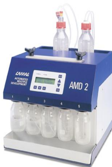
Рис. 4 Камера для элюирования AMD 2

Камера AMD 2 предназначена также для сложных многокомпонентных проб, анализируемых с использованием многоступенчатого градиентного элюирования.