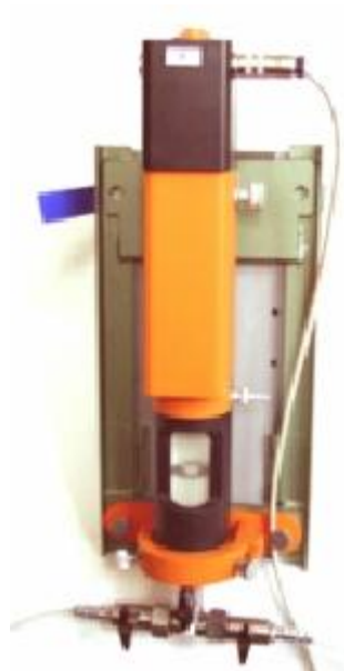
Рисунок 2 Общий вид нивелира гидростатического ASW2000