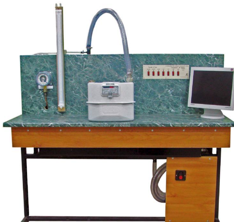
Рисунок 1 – Общий вид