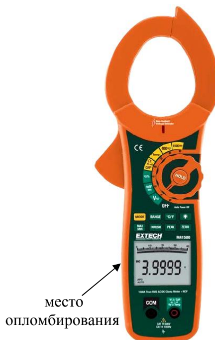
Рисунок 9. Модель MA1500