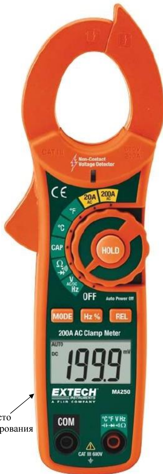
Рисунок 5. Модель MA250