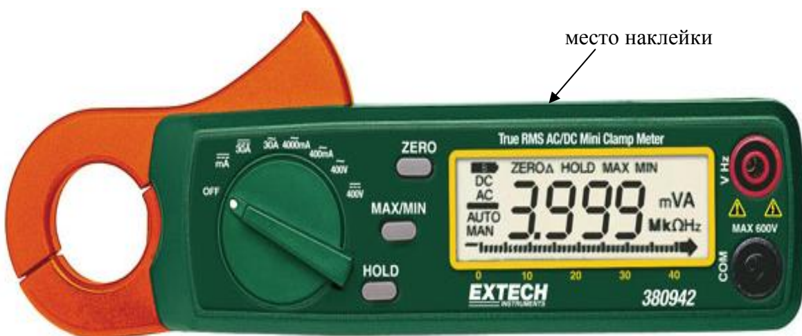
Рисунок 11. Модель 380942