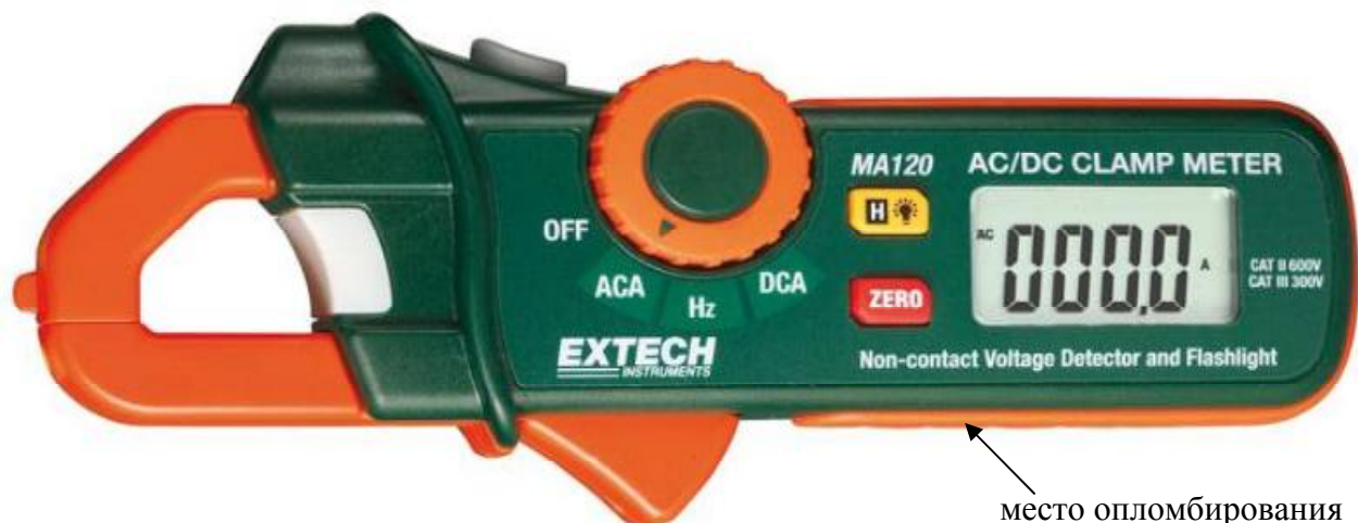
Рисунок 1. Модель MA120

Внешний вид клещей изображен на рисунках 1 – 14.