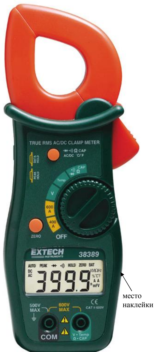
Рисунок 14. Модель 38389