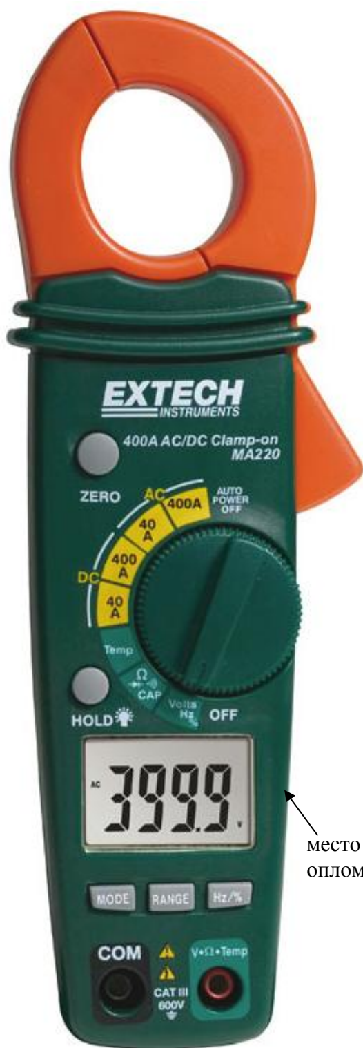
Рисунок 4. Модель MA220