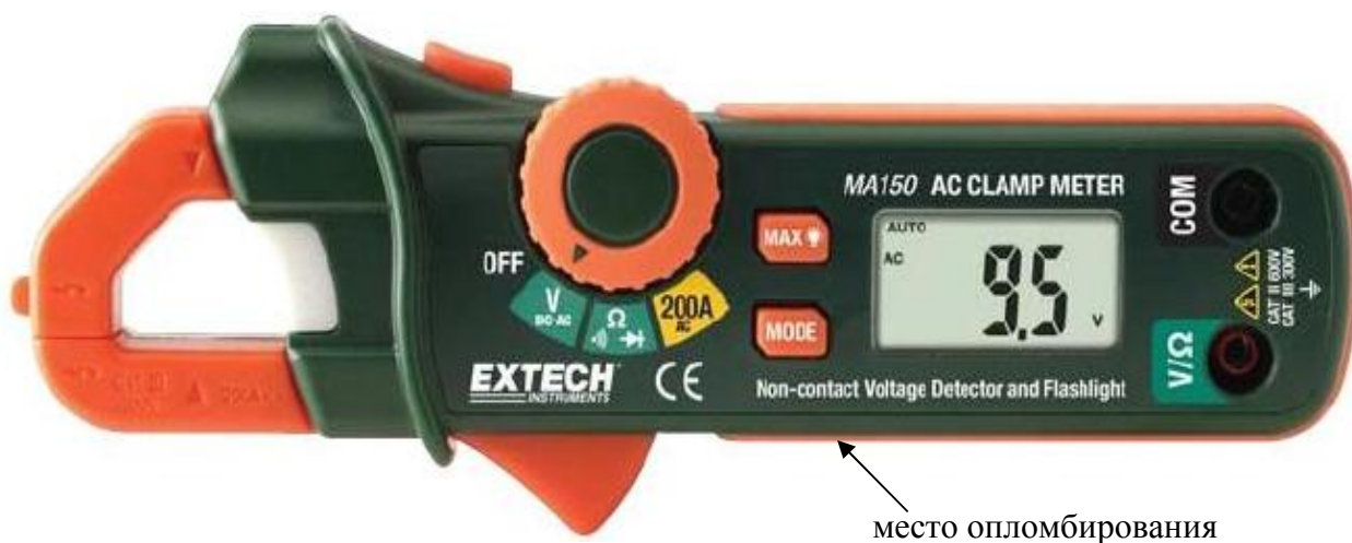
Рисунок 2. Модель MA150