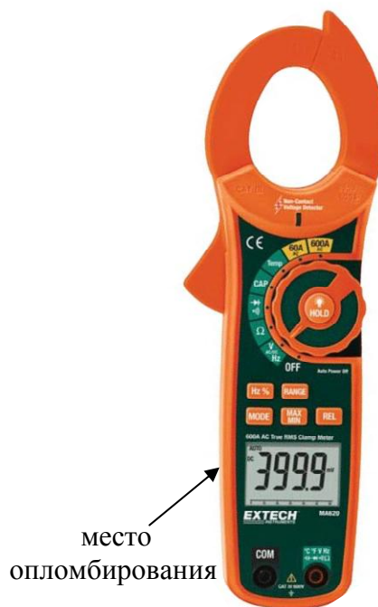
Рисунок 7. Модель MA620