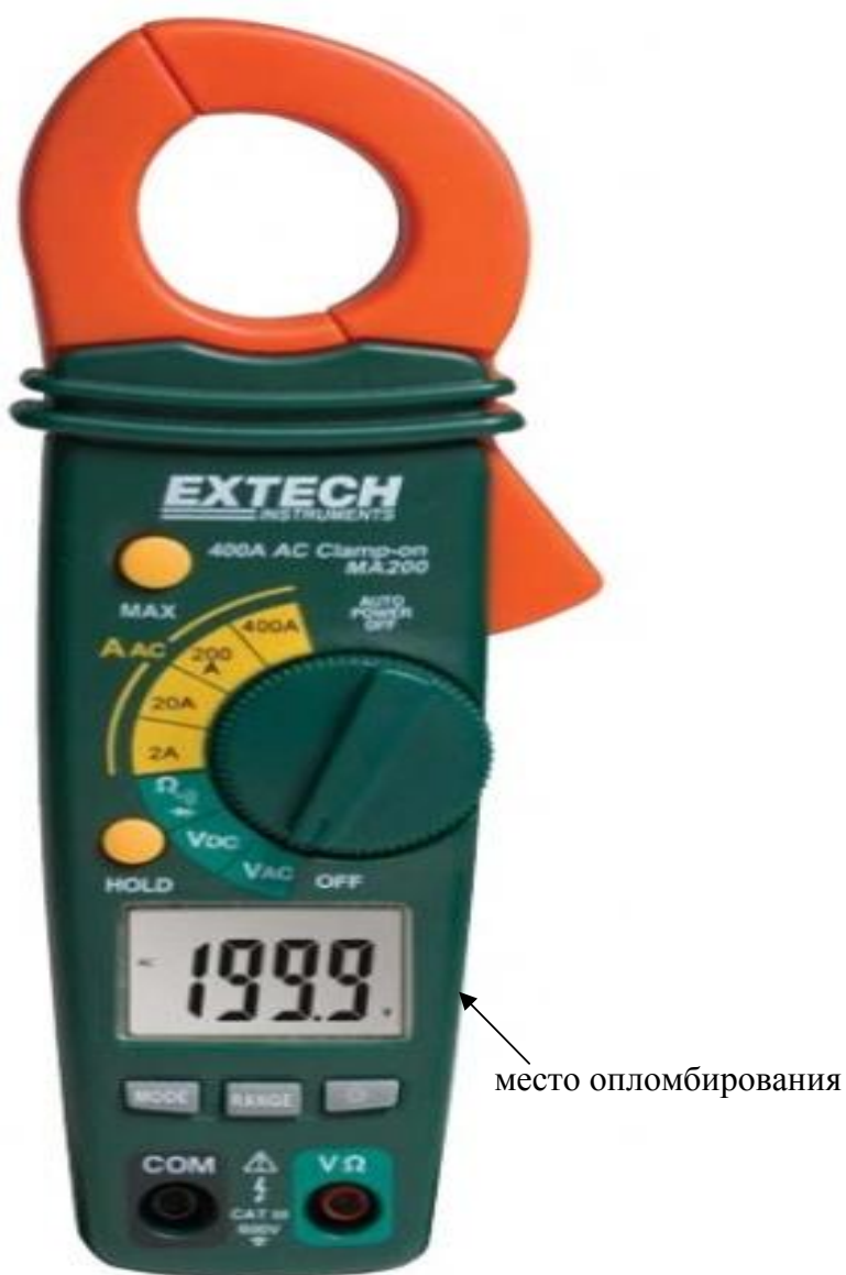
Рисунок 3. Модель MA200