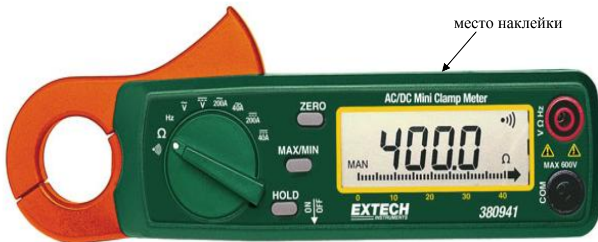
Рисунок 10. Модель 380941