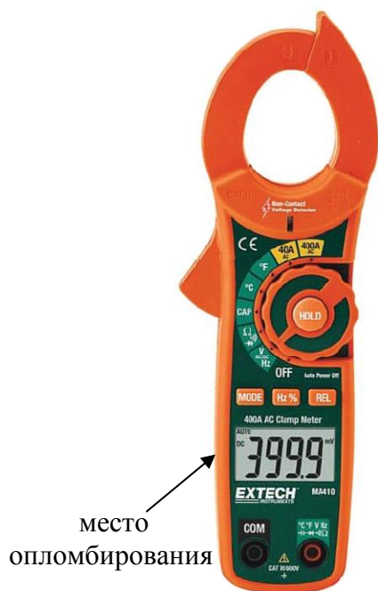
Рисунок 6. Модель MA410