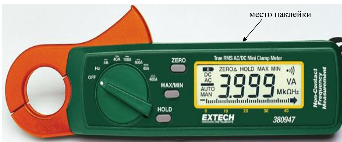
Рисунок 12. Модель 380947