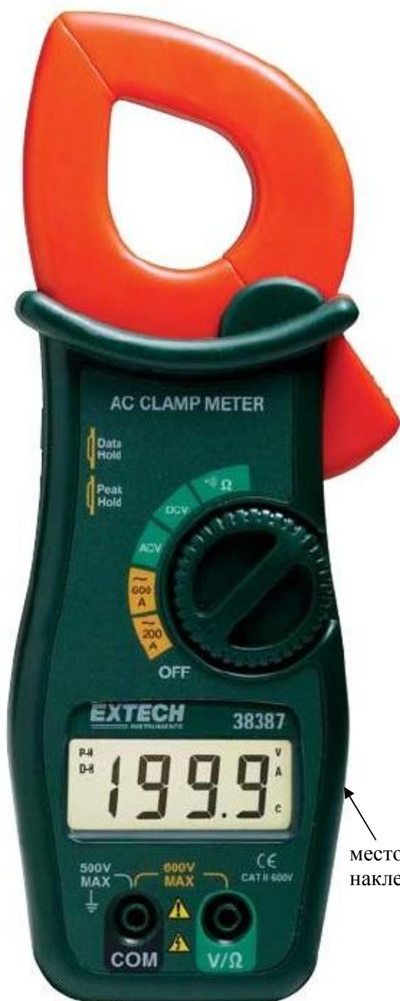
Рисунок 13. Модель 38387