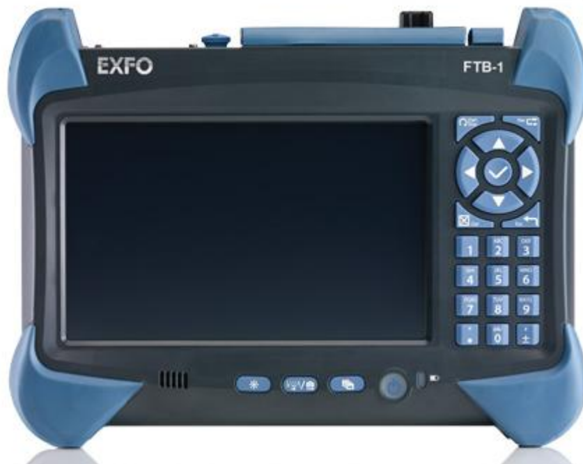
Рисунок 1 – Внешний вид системы измерительной FTB-1