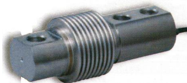
Датчики семейства F60X