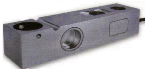
Датчики семейства SK30X