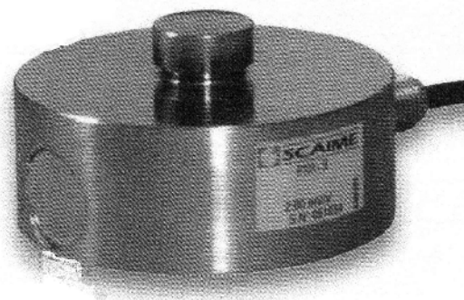
Датчики семейства CB50X