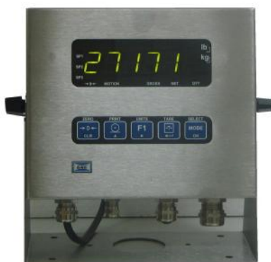
Рисунок 1. Внешний вид электронного блока с изображением версии программного обеспечения.