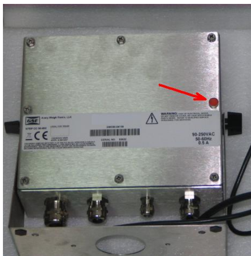
Рисунок 3. Схема пломбировки от несанкционированного доступа и обозначение места для нанесения оттиска клейма.