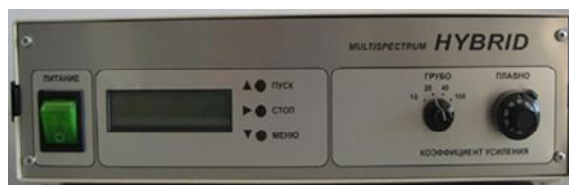
Устройство спектрометрическое Multispectrum HYBRID