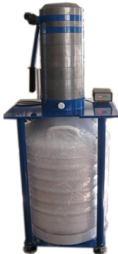
Блок детектирования в сосуде Дьюара и контейнере свинцовой защиты