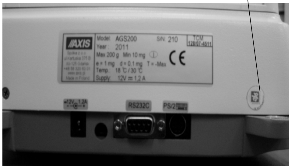
Рисунок 2 – Маркировка и место нанесения пломбы – наклейки, защищающей влагомер от несанкционированного доступа