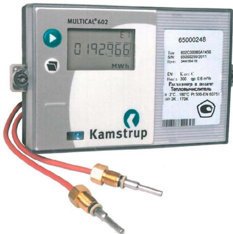
Рисунок 1. Общий вид тепловычислителя MULTICAL® 602