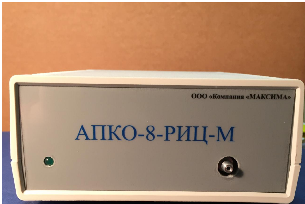
Рисунок 2 - Общий вид средства измерений