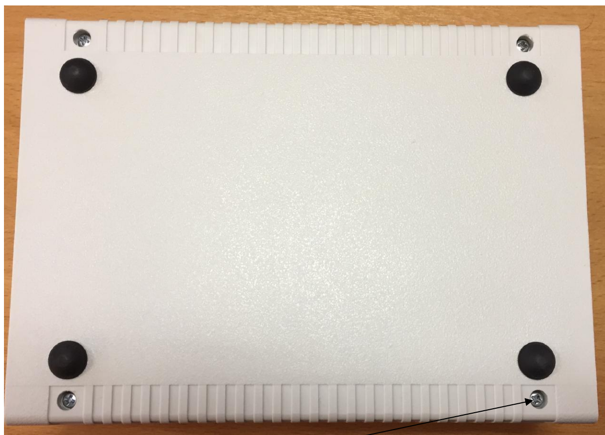
Рисунок 3 - Схема пломбировки от несанкционированного доступа