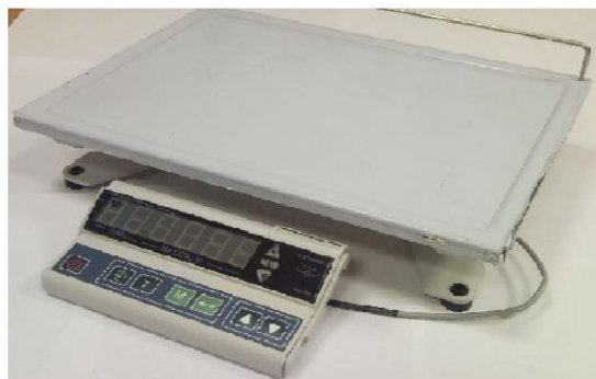
Рисунок 2 Весы модификации: «Меркурий 330-15»

Весы выпускаются четырех модификаций, отличающихся значениями максимальной нагрузки ( M_{max} ), поверочного деления ( e ), равными значениям действительной цены деления ( d ) и имеют обозначения: «Меркурий 330-15», «Меркурий 330-60», «Меркурий 330-150», «Меркурий-330-300», ( M_{max} 6/15 кг, M_{max} 30/60 кг, M_{max} 60/150 кг, M_{max} 150/300 кг, e = 2/5 г, e = 10/20 г, e = 20/50 г, e = 50/100 г соответственно.)