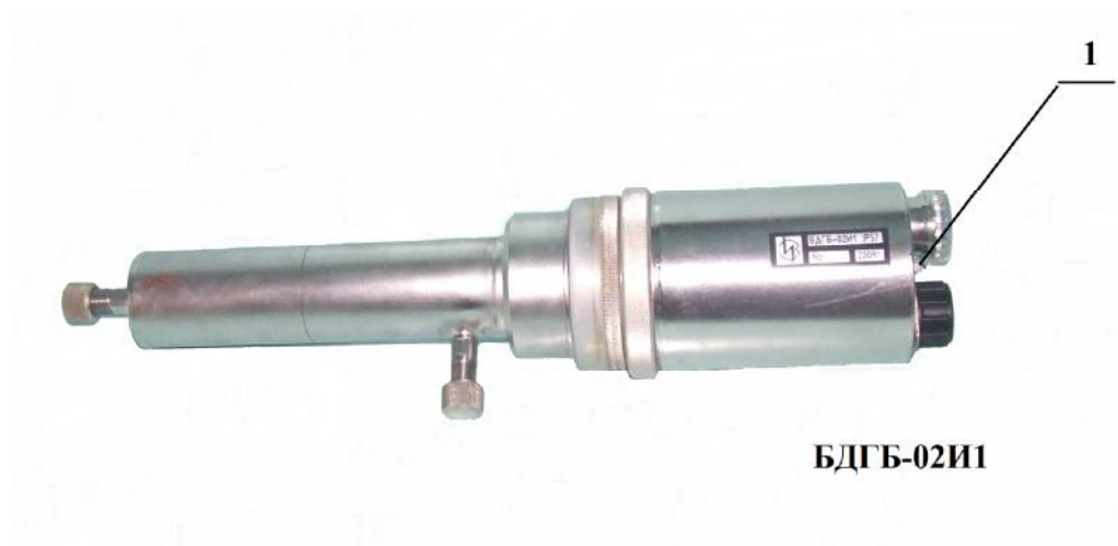
1 – Пломба с оттиском клейма поверителя Рисунок 2 – Общий вид блока БДГБ-02И1