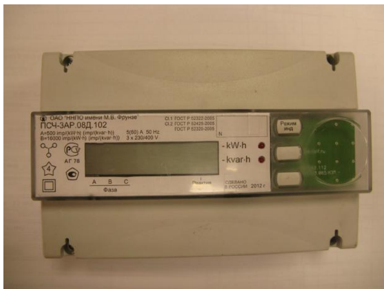
Рисунок 1 – Внешний вид счетчика с ЖКИ и закрытой крышкой клеммной колодки