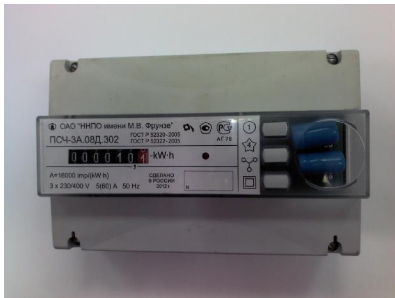
Рисунок 2 – Внешний вид счетчика с УО и закрытой крышкой клеммной колодки Схема пломбирования приведена на рисунке 3.