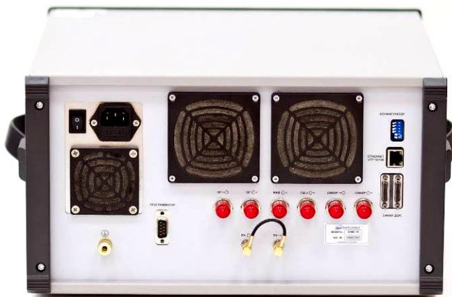
Рисунок 2 – Внешний вид задней панели измерителя