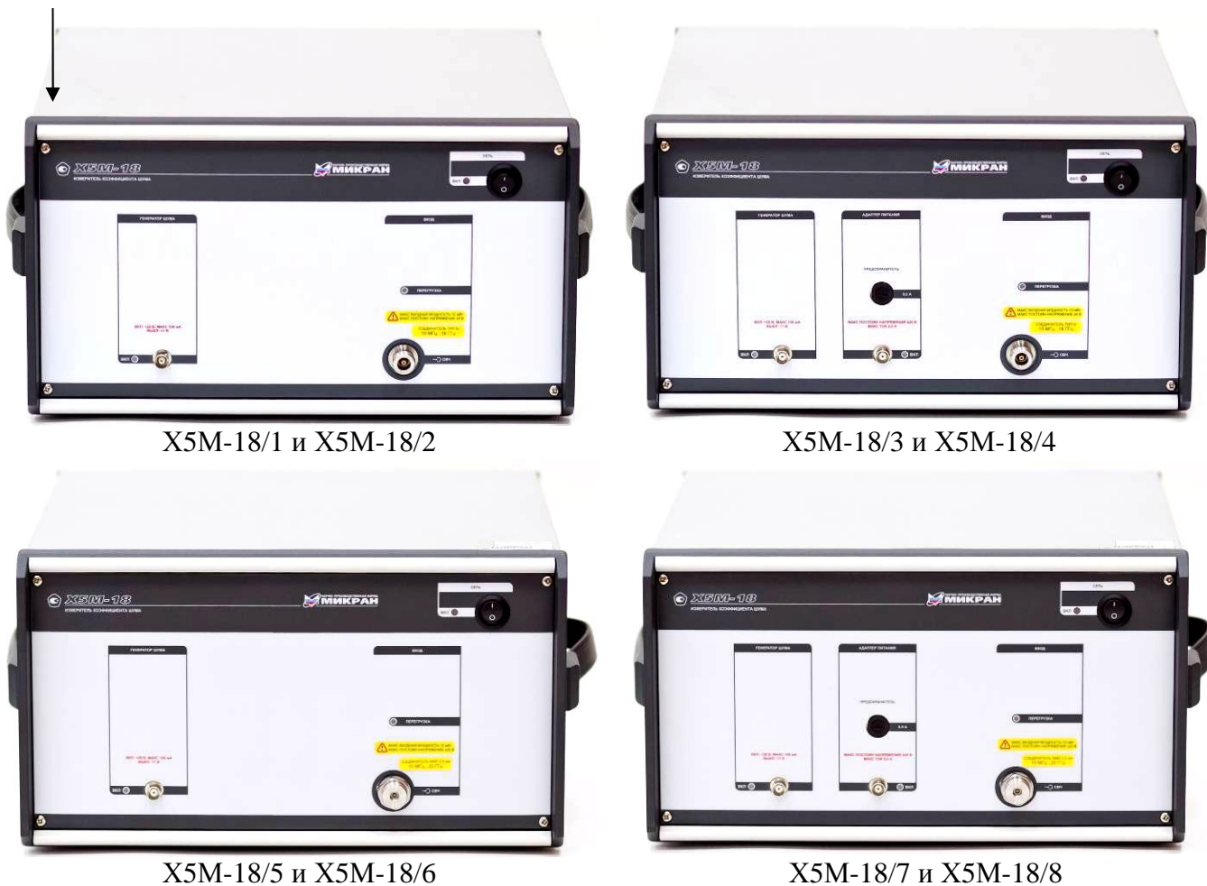
Рисунок 1 – Внешний вид измерителя (передняя панель)

Место нанесения знака об утверждении типа