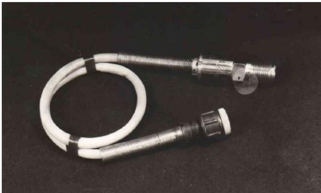
Рисунок 1 – внешний вид датчика

Внешний вид датчика приведен на рисунке 1.