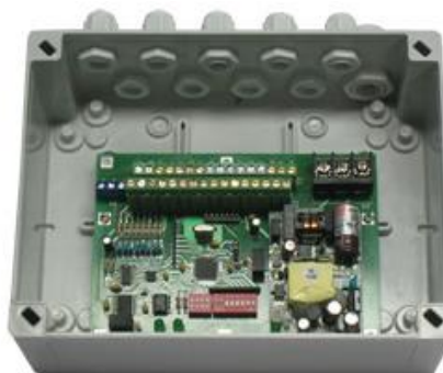
Рис.3 - БОТ-01