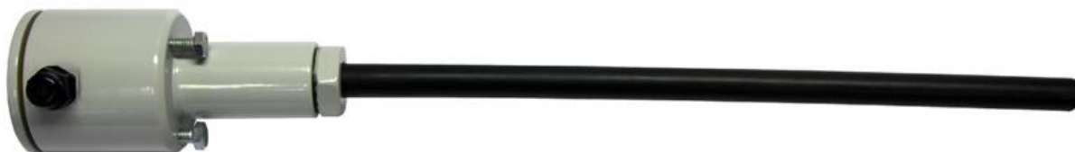
Рис.4 - ТП-01-ХХ-УУ