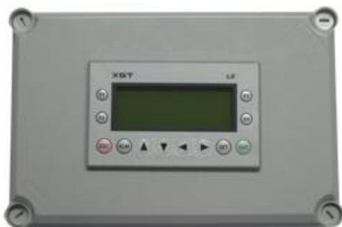
Рис.2 - УК-01

На рисунках 2-4 представлены фотографии компонентов системы АСКТ-01: контроллер УК-01, БОТ-01 и термоподвеска типа ТП-01-ХХ-УУ: