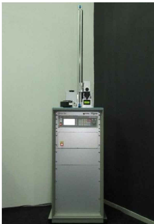
Рисунок 1 – Общий вид ретрорефлектометра RMS 10

Работа на установке может проводиться как в ручном, так и в автоматическом режиме.