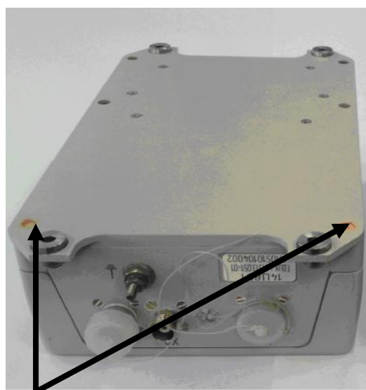
Рисунок 2 - Места пломбировки от несанкционированного доступа