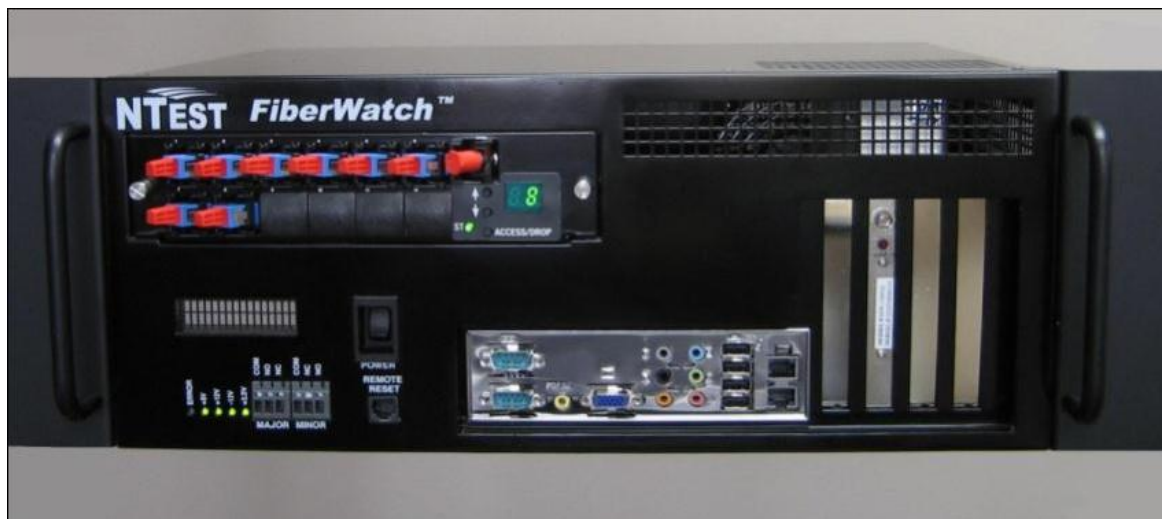
Рисунок 1 - Общий вид системы FiberWatch