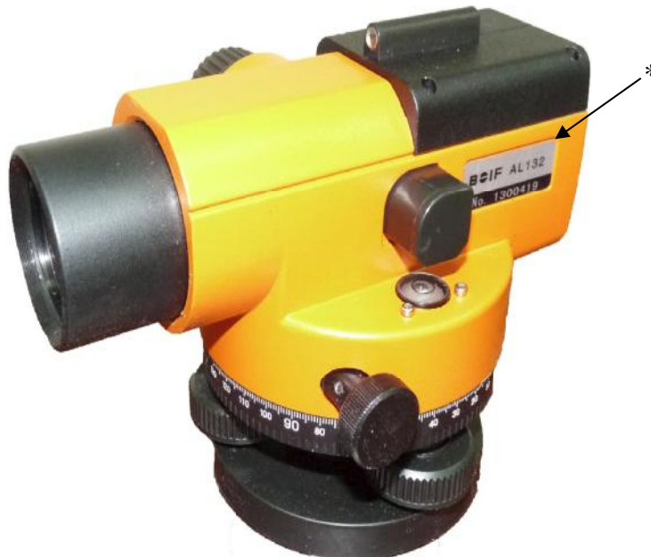
Примечание * - обозначения места для размещения наклейки Рисунок 1 - Внешний вид и место размещения наклейки нивелира

Схема пломбировки от несанкционированного доступа приведена на рисунке 3.