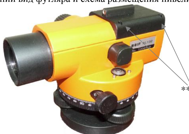
Примечание ** - места пломбирования от несанкционированного доступа Рисунок 3 - Схема пломбировки от несанкционированного доступа нивелира