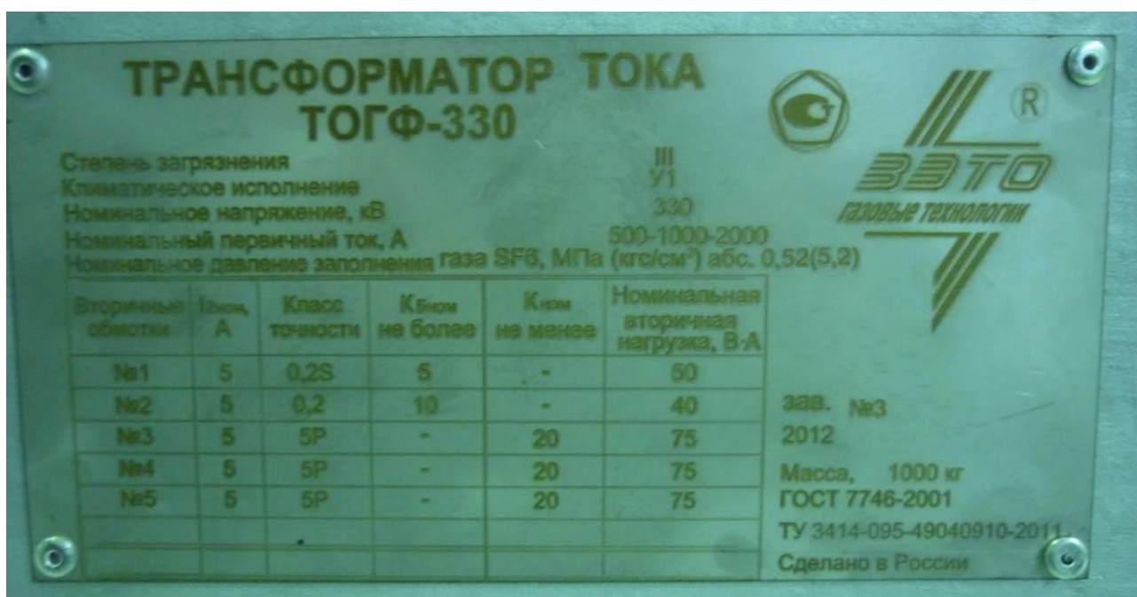
Рисунок 3. Табличка технических данных