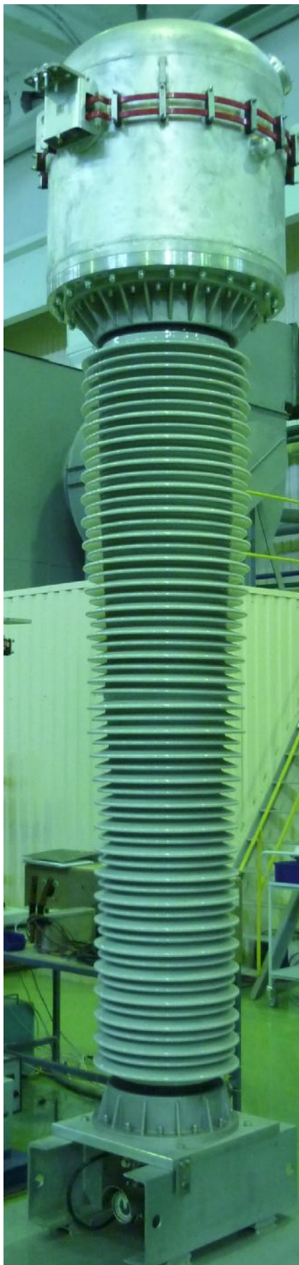
Рисунок 1. Общий вид