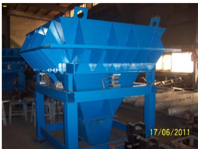
Рис. 1 Внешний вид весов «ВБС»