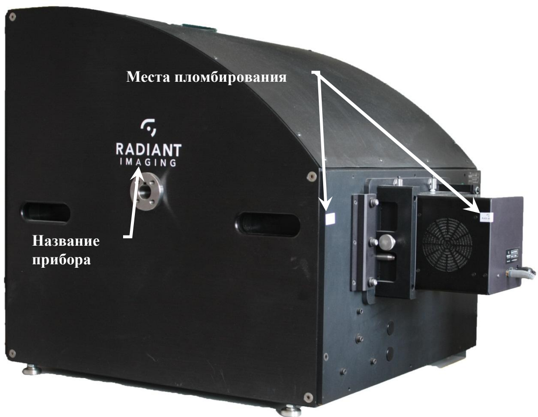
Рисунок 1 – Общий вид установки для измерений силы света и координат цветности источников излучения Radiant Imaging