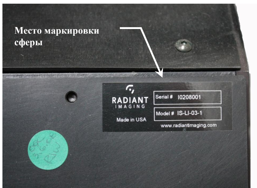
Рисунок 3 – Схема маркировки сферы IS-LI-03-01