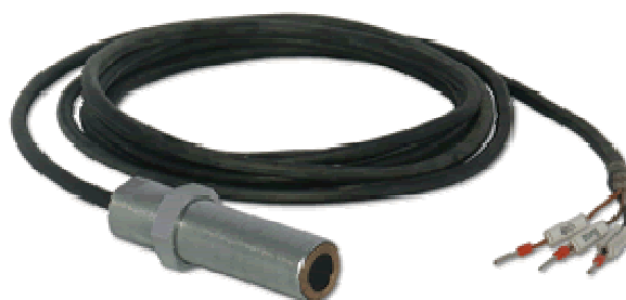
Рисунок 4 - Датчики ДХМ

Внешний вид датчиков ДХМ приведен на рисунке 4.