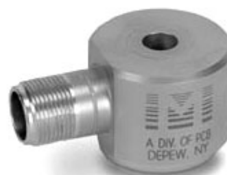
Датчик модели 625B01