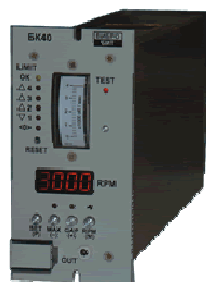
Рисунок 9 - Блоки контроля серии БК

Внешний вид блоков контроля серии БК приведен на рисунке 9.