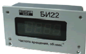
Рисунок 10 - Блоки индикации БИ22 и БИ23

Внешний вид блоков индикации приведен на рисунке 10.