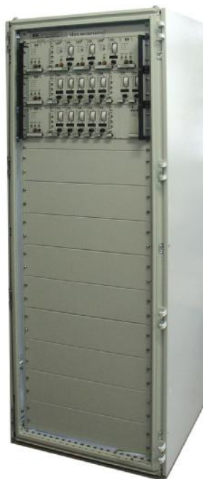
Рисунок 1 - Аппаратура «Вибробит 100»

Внешний вид аппаратуры «Вибробит 100» представлен на рисунке 1, структурная схема представлена на рисунке 2.