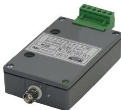
Рисунок 7 - Компараторы моделей К21 и К22

Внешний вид компараторов моделей К21 и К22 приведен на рисунке 7.